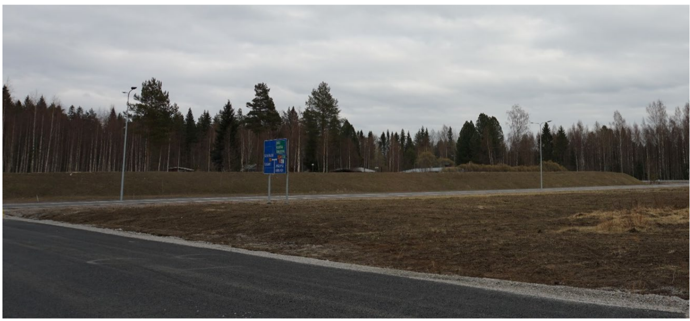
Kuva Puukyläntieltä Rannankyläntielle päin kiinteistön 992-454-1-123 kulmilta.